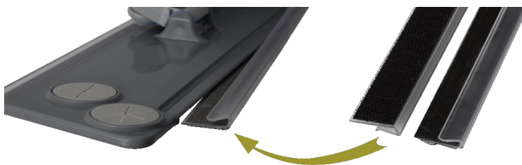
détail de fixation des clips velcro

HTAA1136 LOT DE 2 BANDES VELCRO 40CM DE RECHANGE