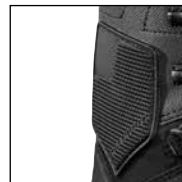
HAIX® Ankle Protector