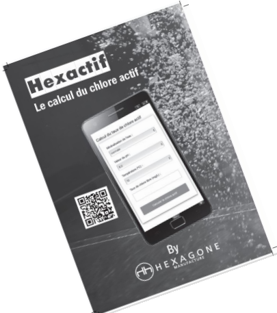
Application hébergée (calcul du chlore actif) via un QR code

Référence : z294f8400004 Relevé d'analyse journalier pour 26 semaines, Tableau et plan de bassin Relevé d'analyse hebdomadaire, diagramme de Taylor