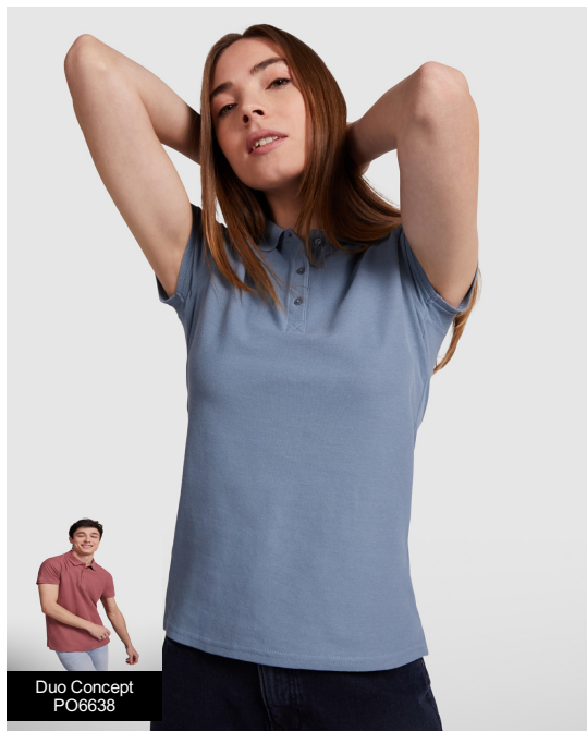
Duo Concept PO6638