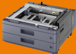
Cassettes universelles PF-7140 (2 x 500 feuilles)