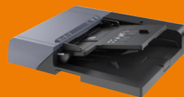
DP-7140 Chargeur de documents (50 feuilles, recto-verso)