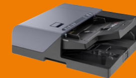
DP-7160 Chargeur de documents dual scan (320 feuilles)