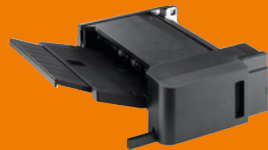
Finisher interne DF-7100 (disponible pour 6009ci/6059i) (500 feuilles), agrafage (50 feuilles) et unité de perforation en option PH-7120