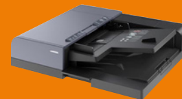
DP-7150 chargeur de documents 140 feuilles, recto-verso)