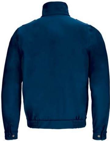
Vue de dos du vêtement